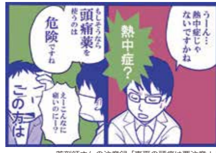
薬剤師さんの注意録「真夏の頭痛は要注意!」 漫画:油沼 (@minddive_9)

最近徐々に気温も上がってきて、暑く感じる日もありますね。このマンガは『暑い日に起こった頭痛で市販の鎮痛薬を使用すると、重篤な副作用が生じるかもしれない...』という内容で、知り合いの漫画家さんと一緒に作ったものの一部です。メガネをかけた薬剤師は私なのですが、似ていますか? (笑) マンガの全体は「薬剤師さんの注意録 夏の頭痛は要注意!」などでネット検索すると出てきます。興味のある方はご覧ください。 最近、市販の薬や健康食品が気軽に購入できるようになりました。買いやすく便利である一方で、かかりつけのお医者さんや薬剤師との関係性は希薄になっているようにも感じます。 今回の話題に限らず、夏場の健康管理・病気の治療・薬の使用には、注意が必要なケースが少なくありません。 本格的な暑さに備えて、情報を整理しておいたり、かかりつけの医師や薬剤師と予め相談しておくとかもよいかもしれません。