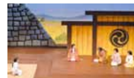
写真：昨年の舞台「重棟」から

【チケット販売所・お問い合わせ】 三木市文化会館 電話0894-83-3300 主催 三木市文化会館(公益財団法人三木市文化振興財団) 三木市・三木市教育委員会